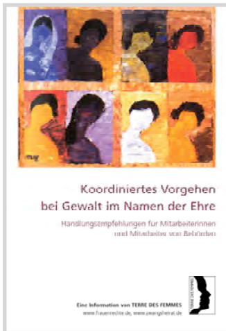
Begleitbroschüre zu den Workshops. Eine aktualisierte Neuauflage ist in Planung.