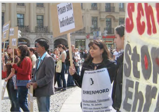
Gemeinsam mit „Scheherazad“ demonstriert TERRE DES FEMMES am 3. Mai 2008 gegen „Ehrenmorde“ in München.