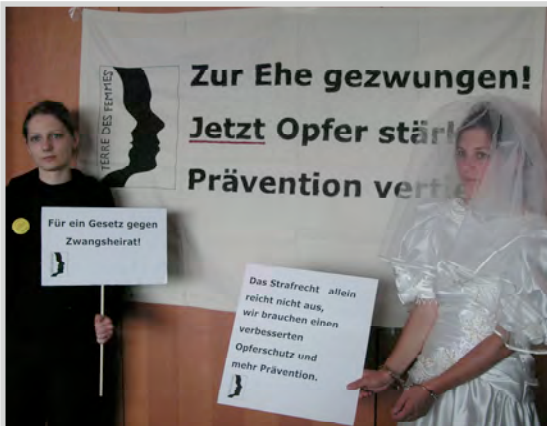
TDF fordert mehr Prävention und Opferschutz. Während einer Pressekonferenz in Berlin, am 19.6.2006