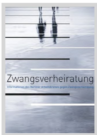
Berliner Interventionszentrale bei häuslicher Gewalt - BIG: Zwangsverheiratung. Informationen des Berliner Arbeitskreises gegen Zwangsverheiratung. Berlin, 2007