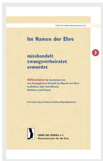
TERRE DES FEMMES/ M. Böhmecke /M. Walz-Hildenbrand: Im Namen der Ehre - misshandelt - zwangsverheiratet - ermordet. Hilfsleitfaden für die Arbeit mit von Zwangsheirat bedrohten oder betroffenen Mädchen und Frauen. Tübingen, 2007