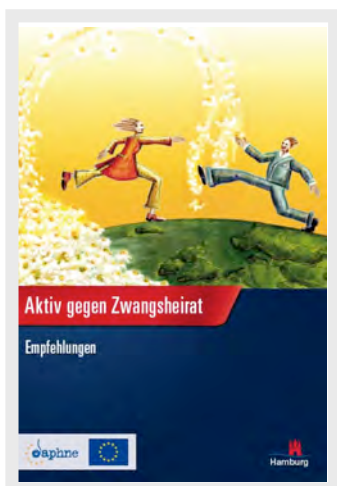
Freie und Hansestadt Hamburg. Behörde für Soziales, Familie, Gesundheit und Verbraucherschutz. Amt für Familie, Jugend und Sozialordnung. Aktiv gegen Zwangsheirat! Empfehlungen. Hamburg, 2009